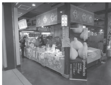
まるごと十和田マーケット(7月)