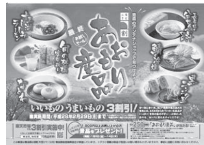
第 3 回チラシ