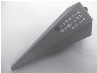
青森県知事賞 セイリングのふかうら 雪人参ビーフシチュー