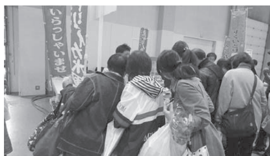
第6回ぜ～んぶあおもり大農林水産祭&津軽海峡ブランド博 2015（青森産業会館）