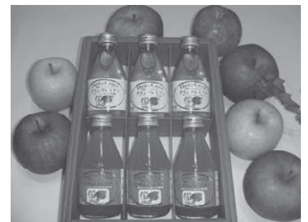
青森県農林水産部長賞 Hot&Cool 浪岡アップル ㈱イダー グランプリミアム(白) 3 本、(PG) グランプリミアム(赤) 3 本朱赤 箱ギフトセット

オ 表彰式：平成 27 年 11 月 8 日(日) (第 6 回ぜ〜んぶあおもり大農林水産祭にて) カ 優良ふるさと食品中央コンクール受賞商品