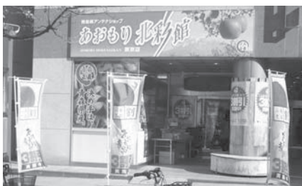
あおもり北彩館東京店 店頭