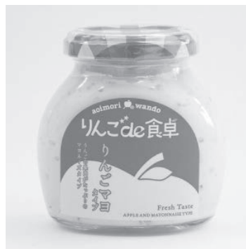
青森県農林水産部長賞 りんご de 食卓 (りんごマヨタイプ)