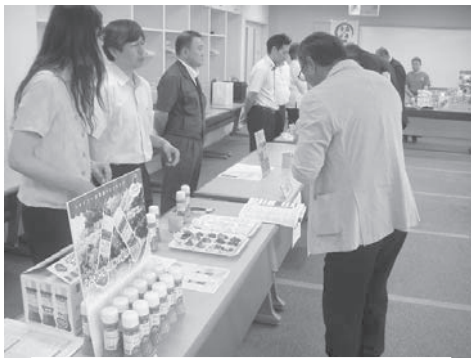
出品者の商品説明&審査