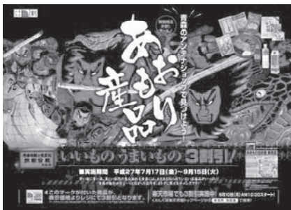
第 1 回駅貼りポスター