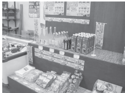
ファームヴィレッジなんぶ・同