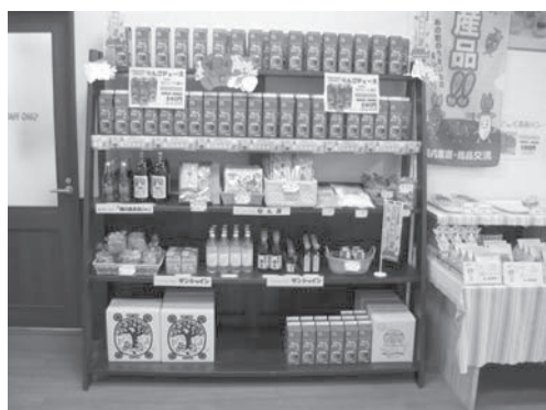
アグリの里おいらせ・交流商品棚