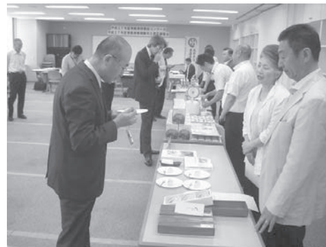
同・グループ入替