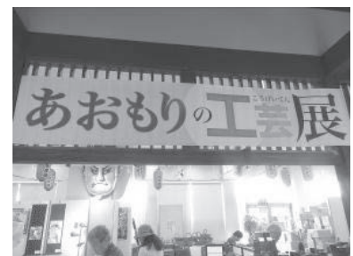
あおもりの工芸展(8月)