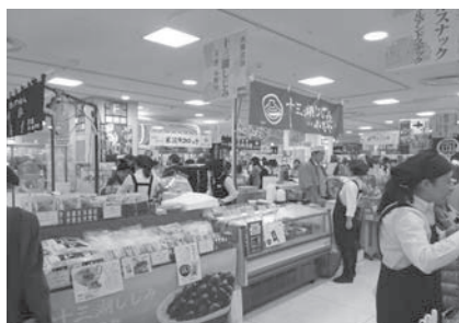
第5回大東北展（ジェイール名古屋高島屋）

注：3月に開催していた催事であるが4月の開催となったため、26年度内の開催がなかった。