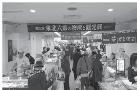
第22回東北六県の物産と観光展（熊本鶴屋）