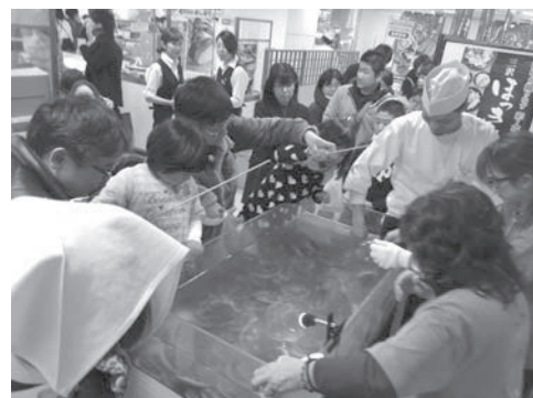
ホタテ釣りイベント