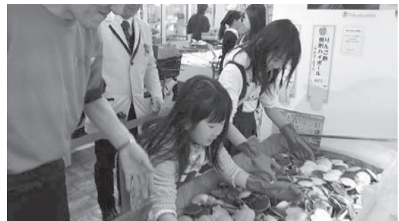
ほたてつかみ取りイベント