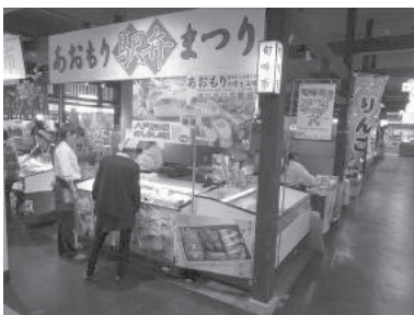
あおもり駅弁まつり(4月)